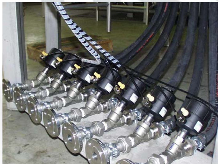
Серия электромагнитных клапанов: 21A